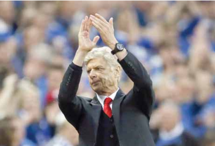
■ ارسين فينجر مدرب أرسنال

للمرة ١٩ وهو رقم قياسي حيث سواجه ليفربول أو استون فيلا. وأبلغ فينجر الصحفيين «في النهاية كنا محظوظين قليلا لأن الحارس ارتكب خطأ. أتفهم أنه يشعر بالاضطراب الآن لكنه أبقى عليهم في المباراة لفترات طويلة. «أراد ريدينج حقا التأهل.. كانوا مستعدين للموت في اللعب للوصول للنهائي. يجب أن نهتمهم على الجهد الذي يبذلوه اليوم.» وكان ريدينج منماسكا ورغم أنه افترض للجودة في المناطق الأمامية إلا أنه أجبر كبار الدوري الإنجليزي الممتاز على اللعب بعشوائية تظهر في المعتاد في درجات الدوري الأدنى. وكانت أغلب فترات المباراة سيئة وأبقى ريدينج خطوه المنظمة جيدا وراء الكرة بتعليمات بالا تصل لأقدام منافسهم في وسط اللعب على أرضية ويمبلي. لكن عندما أدرك جارث مكليري التعادل بعد تسع دقائق من بداية الشوط الثاني عقب تقدم ارسنال عن طريق سانشيز ساد احساس - لفترة قصيرة - بإمكانية حدوث مفاجأة. ■