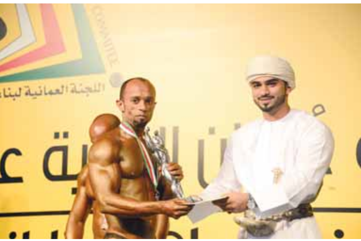
■ .. ويكرم العارضين