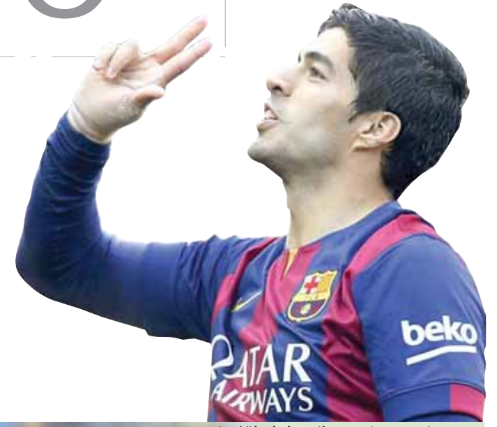
■ لويس سواريز يحتفل بهدفه في فالنسيا

الجبهة الهجومية ومرمر كرة مقشرة الى الاوروغوياني لويس سواريز الذي تابعها بيميناه في شبك الحارس البرازيلي ديفغو الفيش.