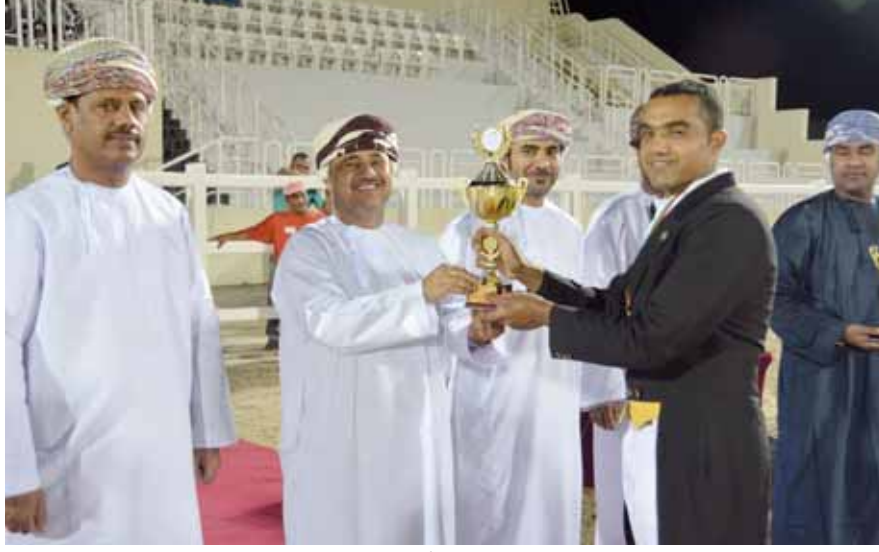
■ الخيالة السلطانية تحصد لقب أفضل فارس مكر للفئة المفتوحة

■ اختتمت مساء أمس الأول مسابقات أدب الخيل (الدرياسج) للموسم ٢٠١٤/٢٠١٥ م والذي ينظمها الاتحاد العماني للفروسية، وذلك على ميدان مزرعة الرحبة بولاية بركاء، تحت رعاية سعادة محمد بن راشد القنوبي عضو مجلس الشورى ممثل ولاية بركاء بحضور سعادة الشيخ راشد بن احمد الشامسي نائب رئيس مجلس إدارة الاتحاد العماني للفروسية والدكتور جمعة بن راشد المشايخي امين السر العام بالاتحاد واحمد بن سيف العبري امين الصندوق رئيس لجنة المسابقات بالاتحاد وعدد من المسؤولين والمهتمين برياضة الفروسية من مختلف وحدات الخيالة الحكومية وجمع غفير من الجماهير. حيث شارك في المسابقة الختامية مجموعة كبيرة من الخيول من مختلف وحدات الخيالة الحكومية والإسطبلات تم تقسيمها على ثلاث فئات فئة المبتدئين والفئة المتوسطة والفئة المتقدمة، كما قدم الاتحاد عدد من الهدايا والجوائز للجمهور من خلال اجراء سحب في المسابقة. ■ ■ ■