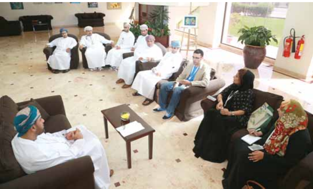
■ من المؤتمر الصحفي لإعلان التوصيات