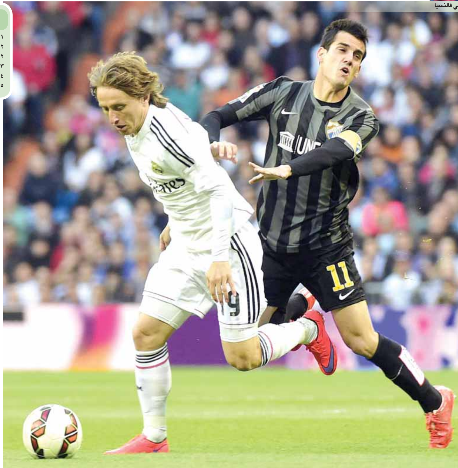
■ لوكا مودريتش يهرب من رقابة جيمينز لاعب ملقة

من جانبه، رفع اورييز رصيده الى ١٤ هدفا هذا الموسم وانفرد بالمركز الثامن على لائحة ترتيب الهادفين. ■