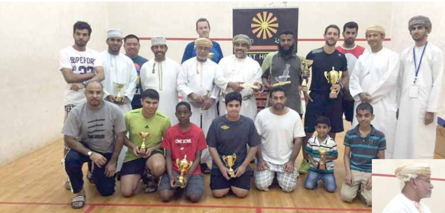
■ لحظة جماعية للمشاركين في المسابقة بعد التتويج

وجاءت منافسات البطولة بمستوى جيد وشهدت الإثارة في عدد من اللقاءات خصوصا على مستوى فئة العموم، وشكلت مشاركة الوافدين من مختلف الجاليات فرصة جيدة للاعبين العمانيين في الاحتكاك بهم، حيث يملك بعض اللاعبين الأجانب مستويات جيدة في هذه الرياضة، ويشترك في البطولة لاعب من دولة