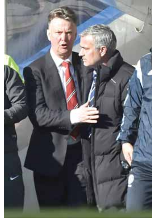
■ جوزيه مورينيو ولويس فان جال