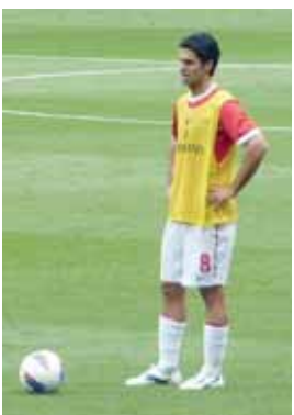
■ ميكل أرتيتا

■ لندن. رويترز: يتوقع ميكل أرتيتا قائد أرسنال المناس في دوري انجلترا الممتاز لكرة القدم تمديد تعاقد مع ناديه اللندني بعد العودة من الإصابة ويتعاقد أرتيتا (٣٣ عاما) من مشكلة في الكاحل ويحرص مدرب أرسنال الفرنسي آرسين فينجر على التمسك بلاعب الوسط الإسباني وتمديد التعاقد معه لمدة ١٢ شهرا جديدة ونقلت شبكة سكاي التلفزيونية عن أرتيتا قوله "هدفي الوحيد هو استعادة سابق لياقتي والأداء على أرض الملعب... وطالما كنت قادرا على القيام بذلك فأنتي على ثقة بالاستمرار في صفوف هذا النادي في ظل هذه العلاقة التي تربطني بالنادي وفي ظل احترامي للجميع هنا، وأضاف أرتيتا الذي انضم لأرسنال في أغسطس ٢٠١١ قوله "في مايو عندما يكون كل شيء على ما يرام سنجلس ونحدث وسيستغرق الأمر خمس دقائق، ولم يشارك أرتيتا الذي خضع لجراحة في الكاحل في يناير الماضي في أي مباراة منذ فوز فريقه على بروسيا دورتموند الألماني في دوري أبطال أوروبا في نوفمبر الماضي. ■