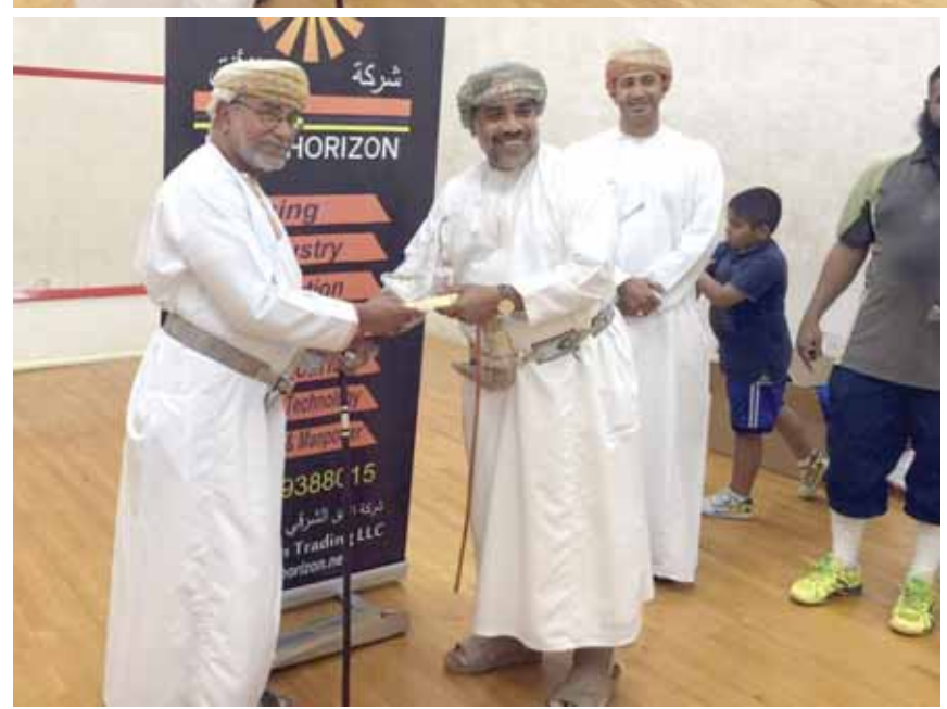
■ من التكريم