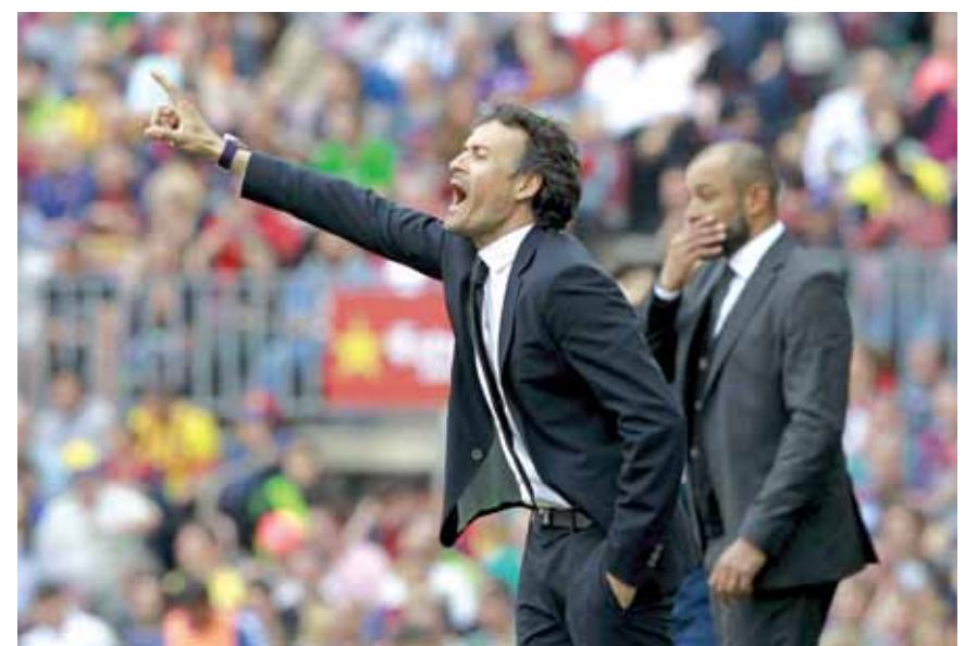
■ لويس إريكي يعطي تعليماته للاعبين لبرشلونة