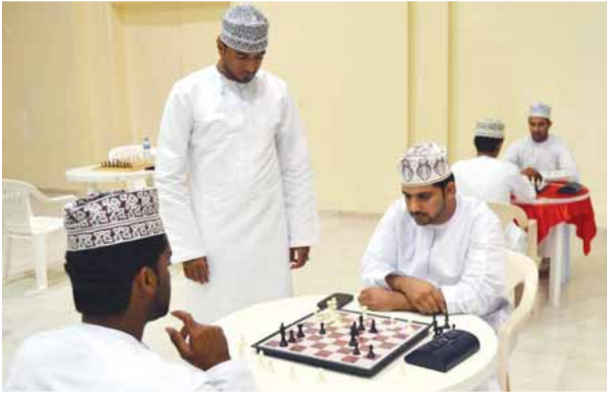
من مسابقة فئة الشباب