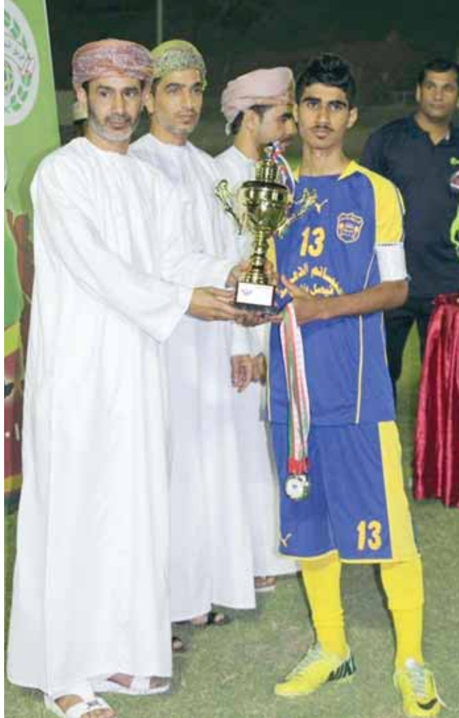
■ .. وفريق وبل بكأس المركز الثاني

ثم قلد راعي المناسبة الميداليات الفضية للاعبي فريق ويل الحاصل على المركز الثاني ثم تقدم قائد الفريق لاستلام كأس المركز الثاني والجائزة المالية ، ثم قلد الميداليات الذهبية للاعبي فريق الجزيرة الفائز بالمركز الأول ، ثم تقدم قائد فريق الجزيرة لاستلام كأس