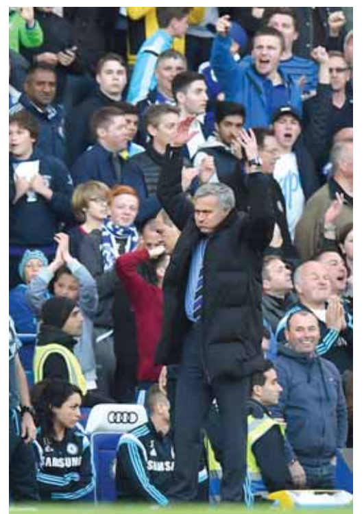
■ جوزيه مورينيو يتابع أداء لاعبيه

وتابع «نسير في طريقنا وأرى أن الفريق يتطور كل اسبوع. كان من الرائع ان نرى كيف ادينا هنا. عندما ترى الاحصاءات لا تصدق أن النتيجة هي مجرد ١-٠ صفر لكن هذه هي كرة القدم. ■