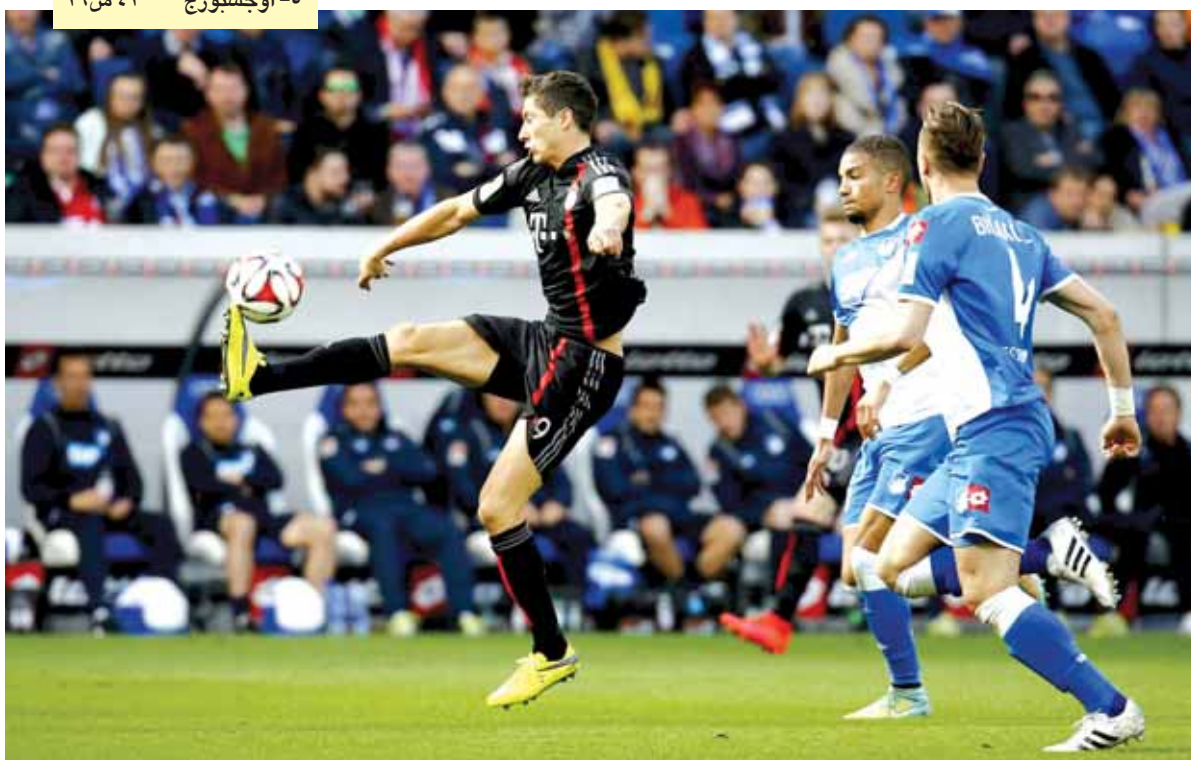
■ روبرت ليفاندوفسكي لاعب بايرن ميونخ يتحكم في الكرة أمام دفاع هونهاج

وسجل للفائز توبياس فيرنز (٧) والباراغواياني راوول بوياديا (٧٣) وللخاسر دانيال غينتشيك (٢٢) الذي سجل هدفه الخامس في اربع مباريات. ■