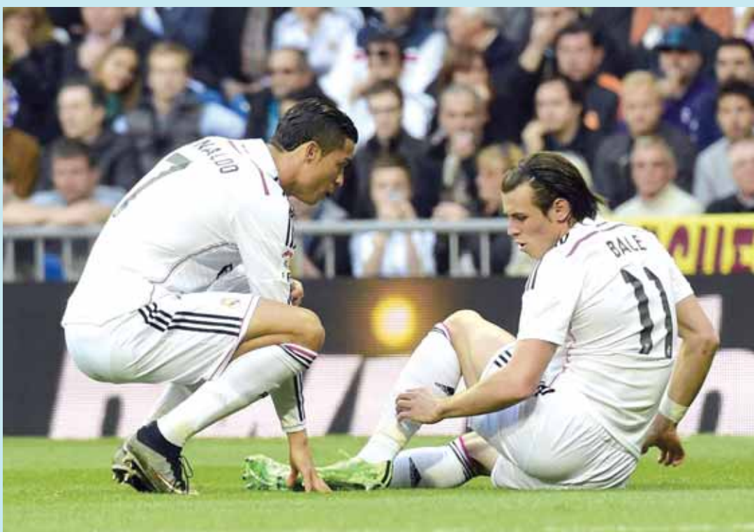
■ جارت بيل يجلس أرضاً عقب إصابته أمام ملقة

وقال مدربه كارلو أنشيلوتي في مؤتمر صحفي «مودريتش لديه مشكلة في الركبة وبيل يعاني من أمر ما