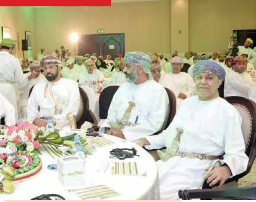
■ من حضور المؤتمر

تفاعل وحضور كبير ومميز شهده مؤتمر عمان الرياضي لعام ٢٠١٥ والذي اقيم صباح امس تحت رعاية معالي السيد سعود بن هلال البوسعيدي وزير الدولة ومحافظ مسقط بفندق كراون بلازا وبحضور معالي الشيخ سعد بن محمد المرصوف السعدي وزير الشؤون الرياضية وعدد من أصحاب المعالي الوزراء والسعادة ورئيس اللجنة الأولمبية العمانية ورؤساء وأمناء سر الاتحادات الرياضية ورؤساء الأندية واللجان الرياضية ورؤساء اللجان الشبابية بالأندية الرياضية وعدد من الشخصيات الرياضية والذي اشتمل على ثلاث جلسات متنوعة. واستهل افتتاح المؤتمر بكلمة ألقاها فهد بن عبدالله بن موسى الرئيسي مدير عام