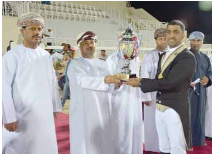
■ وحدة شرطة الخيالة بطلا للفئة المتوسطة