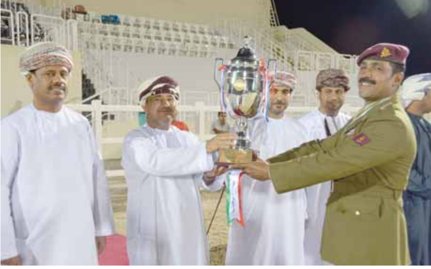
■ خيالة الحرس السلطاني العماني تتوجّه بطلا للفئة المفتوحة