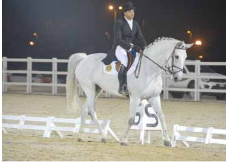
■ من المسابقة