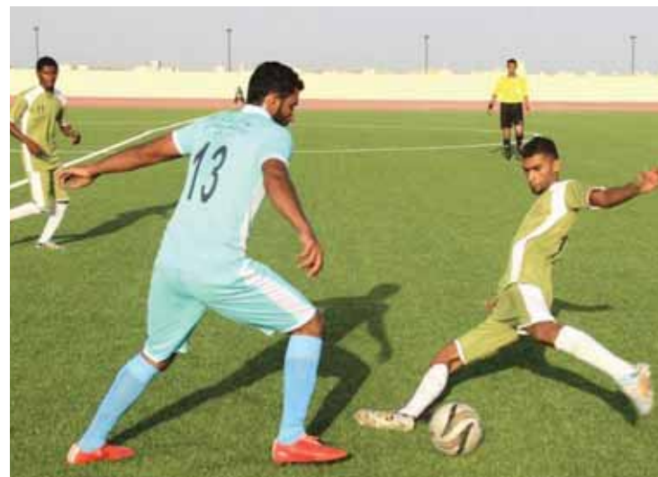
من مباراة البلاد والمعري

إلى هدفين بعد ١١ دقيقة في الدقيقة ١١ الذي استغل كرة في ظهر المدافعين لحق بها قبل الحارس ليسكنها في الشباك الفارغة برأسه في الدقيقة ٣٤ مسجلاً هدف تقليص الفارق ثم سجل