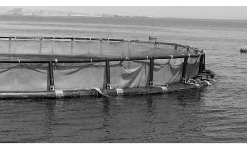
■ احد مشاريع الاستزراع السمكي

أوضحت الإحصائيات الصادرة عن المديرية العامة لتنمية الموارد السمكية بوزارة الزراعة والثروة السمكية والمتعلقة أن عدد المراجعين والاتصالات الهاتفية والاستفسارات عبر شبكة المعلومات العالمية (الإنترنت) الواردة إلى المحطة الواحدة للاستزراع السمكي بدائرة تنمية الاستزراع السمكي بالمديرية والتي تخصص بالاستفسارات عن الاستثمار في نشاط الاستزراع السمكي بنوعيه التجاري والتكاملية خلال العام الماضي ٢٠١٦م قد كانت على النحو التالي: ٥٠٠ مراجع المحطة الواحدة للاستزراع السمكي و ٨٢ اتصالا هاتفيا أما بالنسبة للأسئلة عن طريق شبكة المعلومات العالمية ومواقع التواصل الاجتماعي مثل خدمتي (تويتر) و(الفيس بوك) فقد بلغت ٢٠٠ استفسار وذلك خلال الفترة من بداية شهر يناير وإلى نهاية شهر ديسمبر من العام الماضي ٢٠١٦م. وقد تنوعت الأسئلة والاستفسارات التي وردت إلى المحطة الواحدة للاستزراع السمكي حول طلب المعلومات عن الاستزراع