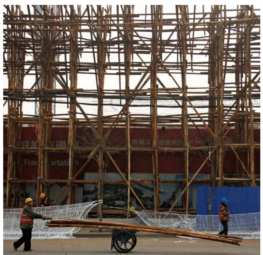
عمال يجهزون سقالة خشبية في موقع بناء ببيكين امس الاول

«بوكيمون جو». ومن بين التحديات التي تواجه تطوير تقنيات أحدث في عالم «الواقع المعزز» هو أن أي نظام لن يحتاج فقط إلى تتبع المستخدم كمستخدم، وإنما إلى تتبع الأشياء الأخرى في البيئة المحيطة به. وتشير وثائق طلب تسجيل براءة الاختراع الذي قدمته مايكروسوفت إلى أن التطبيق الذي طورته يحل هذا التحدي. وسيعمل التطبيق الجديد مع منصة «الواقع المعزز» الخاصة بشركة مايكروسوفت والتي تحمل اسم «هولو لينس». ومع انتشار تكنولوجيا «الواقع المعزز»، فإنه قد يكون في مقدور المستخدم أن يسأل تطبيقات المساعد الرقمي مثل «كورتونا» الذي طورته مايكروسوفت أو «سيربي» أو «بوكيمون جو». ويحسب طلب الحصول على براءة الاختراع، يقضي الإنسان الكثير من الوقت لكي يعثر على الأشياء المفقودة. على سبيل المثال، فإن البحث عن مفاتيح السيارة أو المحفظة أو الأجهزة المحمولة المفقودة في المنزل، مسألة مزعجة وتبذل الكثير من وقت الناس. كما أن شيسان أن علب اللبن في الثلاجة نفدت، ستجعل الشخص مضطرا للذهاب مرة أخرى إلى المتجر، ولذلك فالتقنية الجديدة يمكن أن تقدم الحل الأمثل لهذه المشكلة. وتتوقع مايكروسوفت وصول عدد الأجهزة المزودة بتقنية «الواقع المعزز» إلى حوالي ٨٠ مليون جهاز بحلول ٢٠٢٠ مقابل حوالي ٦٥ مليون جهاز حاليا في العالم. ■