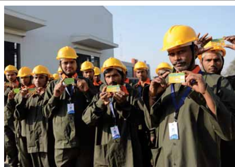
عمال هنود يعرضون بطاقاتهم البنكية قبل بدء العمل في مصنع للصناعات الثقيلة قرب احمد اباد امس حيث كانت الحكومة الهندية قد حددت موعدا نهائيا لإيداع العملات غير الصالحة بالبنوك بنهاية الدوام امس الاول

استمرار حركة التوظيف في شركات القطاع في العام الجديد في ظل ضعف نمو الإنتاج. يشار إلى أن عدد الموظفين الجدد الذين التحقوا بالقطاع في العام الماضي بلغ نحو ٢٧ ألف شخص. ويبلغ إجمالي العاملين في قطاع صناعة المعادن والإلكترونيات في ألمانيا أكثر من ٣,٨ مليون شخص، وتبلغ قيمة مبيعات القطاع نحو ١,١ تريليون يورو سنويا. ■