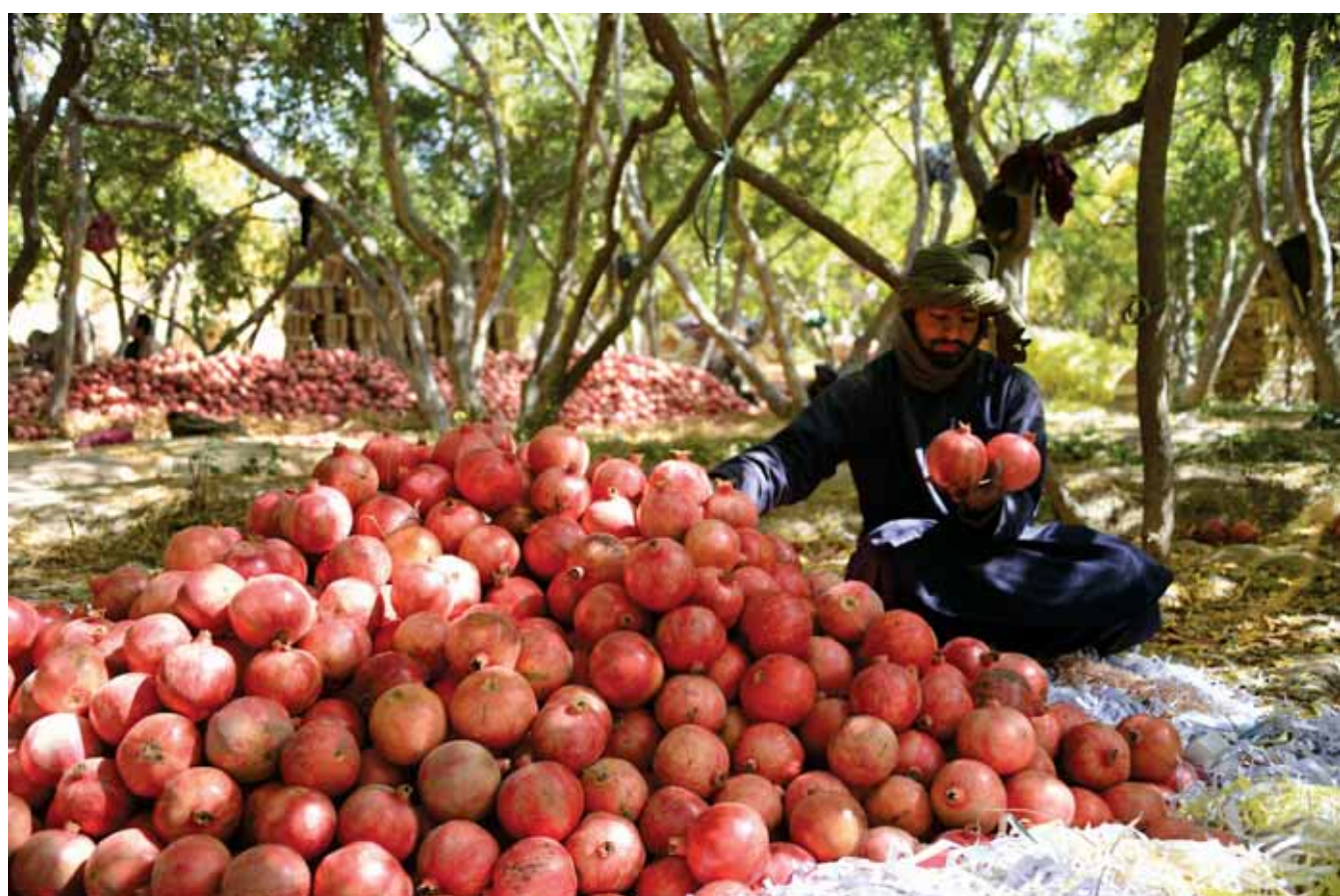
بائع فاكهة أفغاني يفرز ثمار الرمان بمزرعة في قندهار حيث تسعى الحكومة الأفغانية لتعزيز صادراتها من الفاكهة لتعويض المزارعين بديل عن زراعة الخشخاش

سنغهاي. رويترز: قالت مصلحة الدولة للنقد الأجنبي في الصين أمس الأول إنها ستتكشف اعتبارا من الأول من يناير ٢٠١٧ إجراءات الرقابة على شراء الأفراد للنقد الأجنبي وستزيد العقوبات على التدفقات غير القانونية للأموال لكن الحصص السنوية للأفراد ستظل دون تغيير عند ٥٠ ألف دولار. ويأتي إعلان مصلحة الدولة للنقد الأجنبي أمس الأول وسط قلق من أن اليوان الذي تراجع نحو ٧٪ أمام الدولار في ٢٠١٦ قد يواجه ضغوطا جديدة في العام الجديد في الوقت الذي يبدأ فيه من يقبلون على شراء العملة الأجنبية بحصة سنوية جديدة تبلغ ٥٠ ألف دولار. واعتبارا من الأول من يناير سيحتج على الصينيين الذين يرغبون في شراء عملات أجنبية من البنوك ملء استمارة لتحديد الغرض من الشراء وبيانات أخرى. وقالت مصلحة الدولة للنقد الأجنبي في بيان على موقعها الإلكتروني إنها ستراجع هذه المعلومات والبيانات عن كذب وبشكل مستمر. وأضافت المصلحة أن المنظومة السابقة المتعلقة بالإبلاغ عن شراء الأفراد للنقد الأجنبي كانت بسيطة للغاية وعقبة مما أوجد ثغرات سهلت عمليات تحويل الأموال بشكل غير قانوني وغسل الأموال. ■